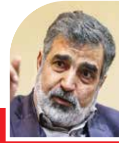
مدیر مسئول: سید اصغر ملاحی