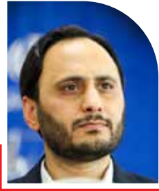
سخنگوی سازمان انرژی اتمی:

مساله هسته ای به اقتصادی ارتباط نیست، اما تا کجا باید نر مش نشان دهیم؟ صفحه ۲