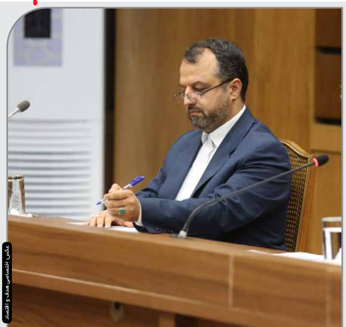
سخن: اختصاصی هدف و اقتصاد

خاندوزی در دیدار با نخست وزیر عراق: برای سرعت دادن به توافق های انجام شده آماده ایم صفحه ۳