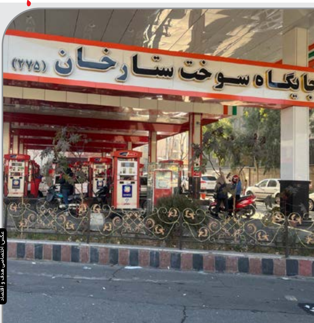
عکس اختصاصی هدف واقتصاد