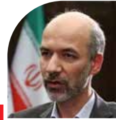
وزیر نیرو و تاکید کرد

استحصال آبهای ژرف و توسعه آب شیرین کن ها به کمک دانش بنیان ها صفحه ۸