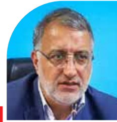
شهردار تهران خبر داد

استحصال آبهای ژرف و توسعه آب شیرین کن ها به کمک دانش بنیان ها صفحه ۸